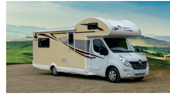
Bett • Dinette Canada AE 2019